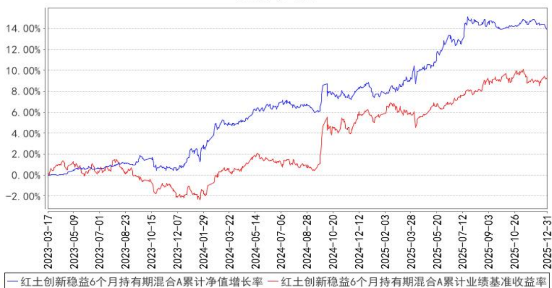
红土创新稳益6个月持有期混合A累计净值增长率与同期业绩比较基准收益率的历史走势对比图